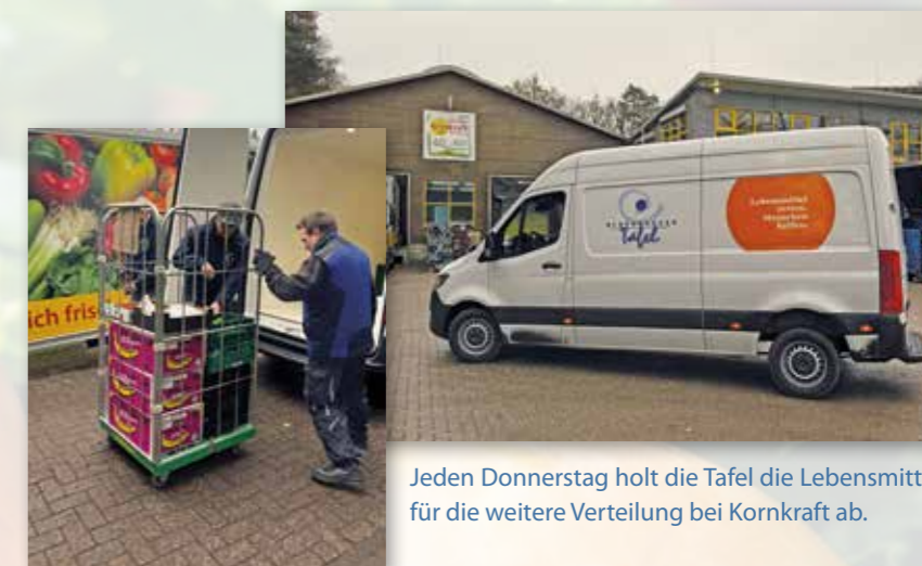
Jeden Donnerstag holt die Tafel die Lebensmittel für die weitere Verteilung bei Kornkraft ab.

Bei unserer Kornkraft Hausmarke setzen wir bei den kleineren Verpackungen auf eine PP-Tüte, das Etikett ist aus demselben Material, so dass ein sortenreines Recycling gut möglich ist. Die großen Gebinde werden in Papiertüten abgepackt. Die Auslieferung erfolgt in Pfand-Napfkisten.